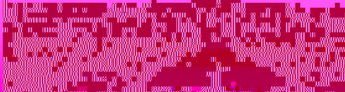
图 1-1-3 国家职业教育教学资源开发与制作中心标识应用